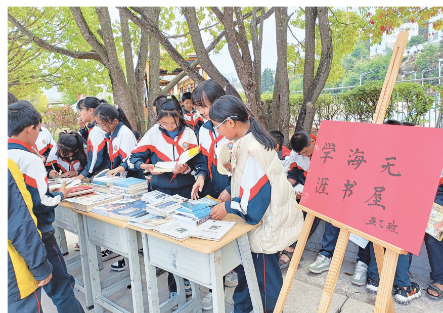
永平县龙街镇中心完小的同学们在进行“学海无涯书屋”好书交流阅读活动。(摄于4月19日)

当天,龙街镇中心完小开展“书香浸润心灵,阅读伴我成长”为主题的书香校园阅读活动,内容包括亲子阅读、好书阅读分享交流等。通过活动,同学们感受到了阅读的力量,在阅读中收获了快乐。