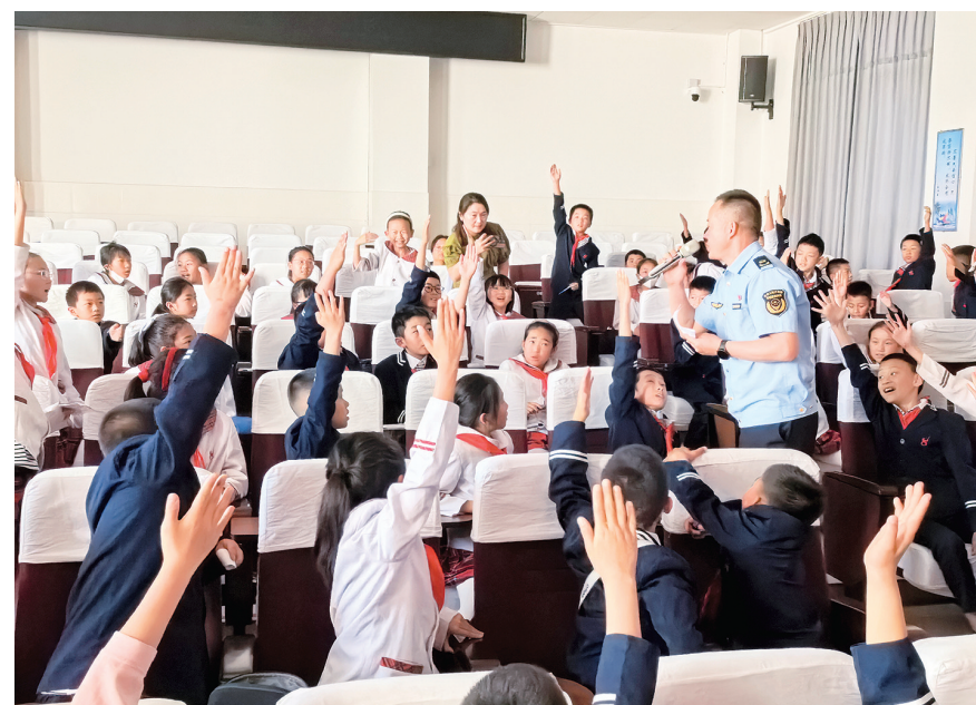
大理市下关八小的同学们在踊跃回答市场监管部门执法人员的问题。(摄于4月15日)

当天,州、市市场监督管理局和州、市教育体育局联合到下关八小开展知识产权进校园活动,举行了知识产权知识宣讲、知识竞赛等活动。下关八小被认定为云南省中小学知识产权教育试点学校,授牌仪式也于当天举行。