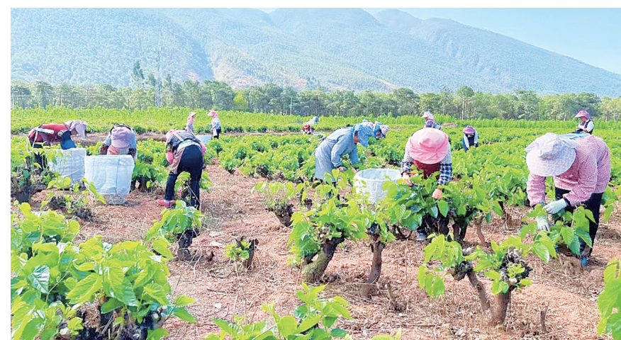
辛屯镇如意村群众在采桑叶。(摄于4月18日)

本报讯(通讯员 杨雪松 文/图) 当下正是桑叶旺盛生长季节,鹤庆县各地蚕农走进桑田采摘桑叶,开始2024年第一批春蚕养殖工作。