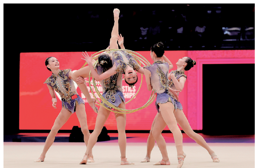
8月27日，中国队选手在比赛中。

汪文斌说，中方将同金砖伙伴一道，继续深化金砖战略伙伴关系，拓展“金砖+”合作模式，充实政治安全、经贸财金、人文交流“三轮驱动”合作架构，不断谱写新兴市场国家和发展中国家团结合作谋发展的新篇章，为推动构建人类命运共同体贡献力量。