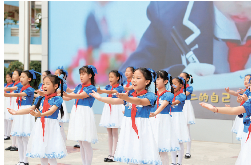
8月28日，南宁市滨湖路小学学生在活动中合唱歌曲。

报告称，截至6月，即时通信、网络视频、短视频用户规模稳居前三，分别达10.47亿人、10.44亿人和10.26亿人，用户使用率分别为97.1%、96.8%和95.2%。