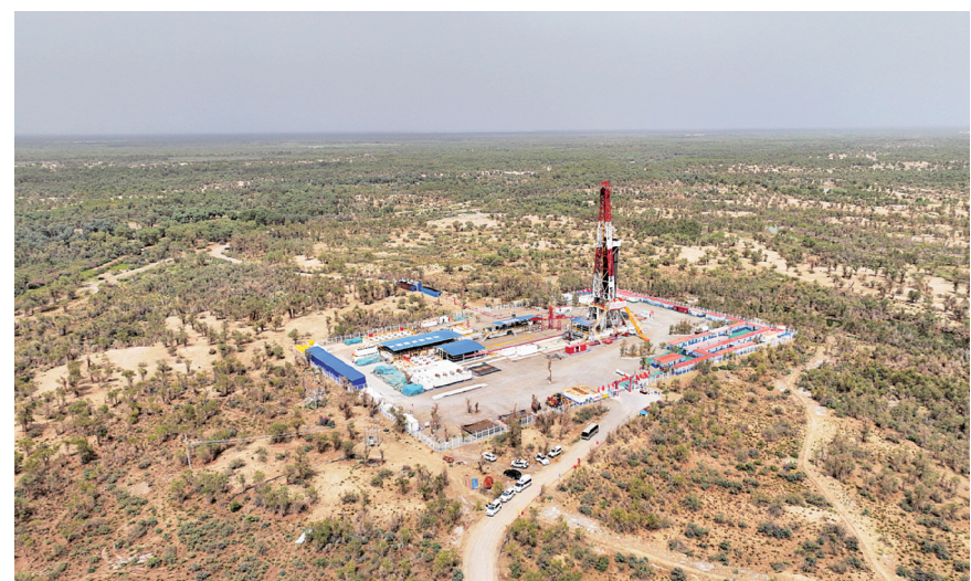
8月21日拍摄的中国石化塔里木盆地“深地工程”跃进3-3XC油气井。该井设计井深9472米，截至8月28日，钻探深度已达8471米(无人机照片)。

位于新疆塔里木盆地塔克拉玛干沙漠的中国石化“深地工程”——顺北油气田平均埋藏深度超过7300米，是世界陆上最深的商业开发油气田之一。顺北油气田目前已钻成垂直深度超过8000米的井50口，实现了26口“千吨井”(单井日产1000吨的油气井)的重大突破。