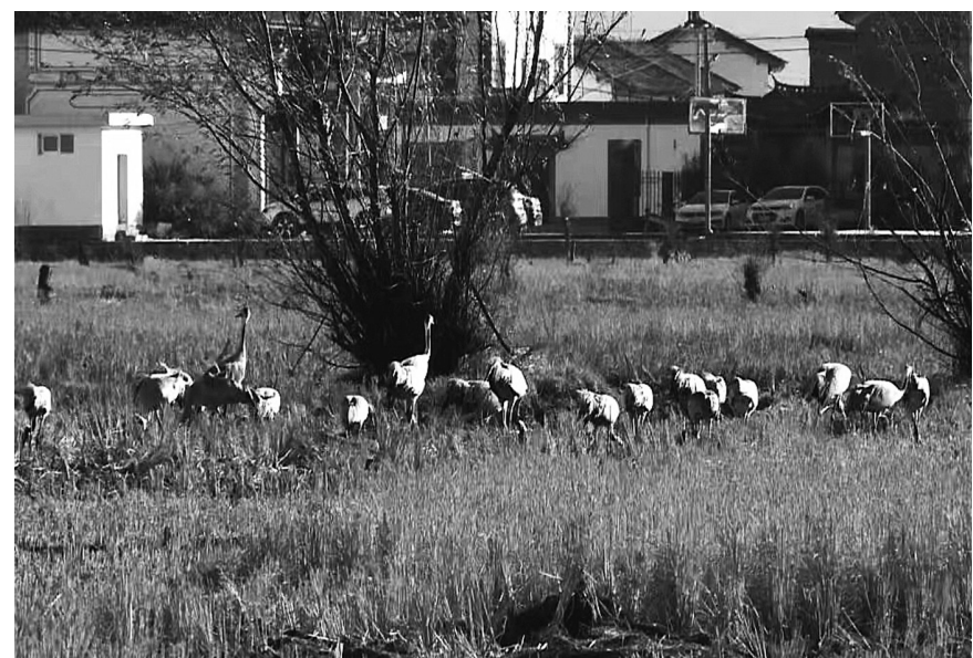
国家二级保护动物灰鹤在鹤庆县东草海湿地附近觅食。(摄于11月26日)

本报讯(通讯员 吴全勇 文/图) 近日，随着气温降低，20多只国家二级保护动物灰鹤飞临东草海湿地附近越冬，这是有记录以来飞临鹤庆越冬数量最多的灰鹤种群。