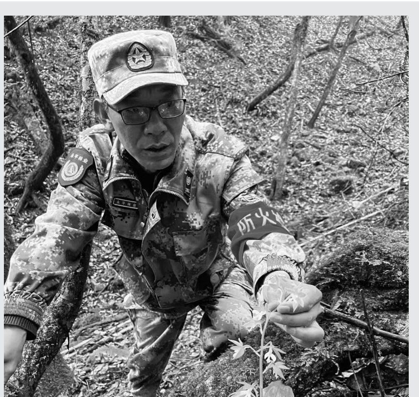
永平金关寺省级自然保护区管护局党员干部正在开展日常巡林护林工作。(摄于11月8日)

日前，滑洞镇辖区内共有39条中小河流、1座小二(二)型水库、1座小坝塘和3条主要农灌沟，镇级河长每月巡河不少于3次、村级河长每月不少于4次，组级河长常态化开展巡河工作；同时，利用“三会一课”、主题党日等活动，组织党员群众清理河流及周边垃圾，大大提升了人居环境。 [通讯员 左孝婷 李佳琴 摄影报道]