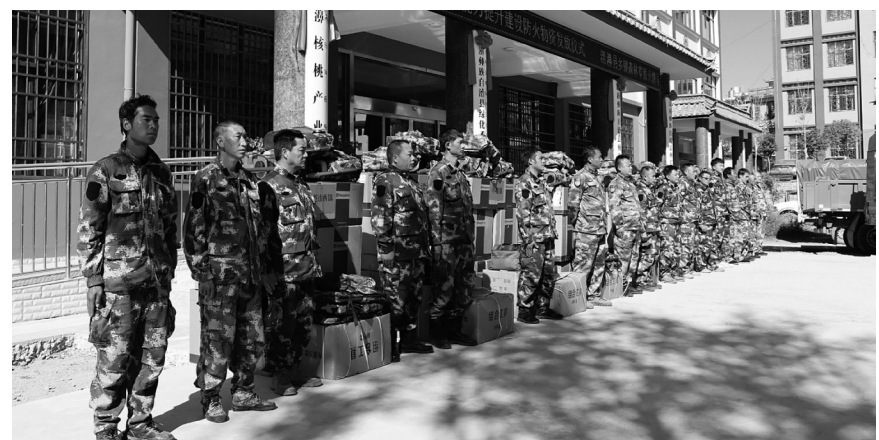
11月18日，漾濞县举行全县重点乡镇森林草原防火物资储备发放仪式。此次活动共采购了72台风力灭火机、72台油锯、72支背负式水枪和72套组合工具下发至各乡镇，进一步夯实了基层防火物资储备。

近年来，永平县深入贯彻落实“绿水青山就是金山银山”的发展理念，常态化开展森林防火、巡林护林、林政管理工作，全力筑牢生态安全屏障，用“生态”底色绘就“发展”绿色。