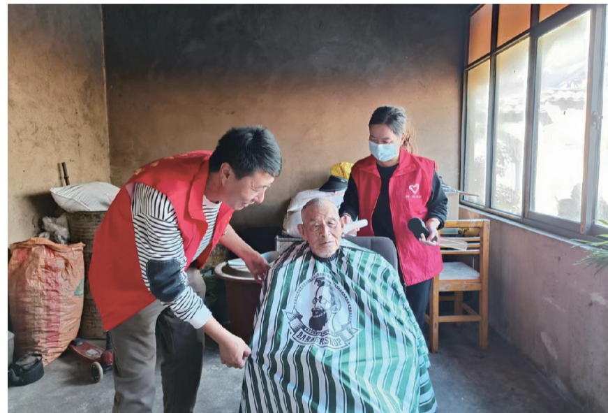
9月27日,剑川县羊岑乡组织辖区理发师到羊村开展“学习雷锋 免费理发”志愿服务活动。活动免费为村内老年人、残疾人、困难群众理发,并对行动不便的人员采取上门服务,弘扬了尊老爱幼、助残扶弱的中华民族传统美德,增强了群众的幸福感和满意度。