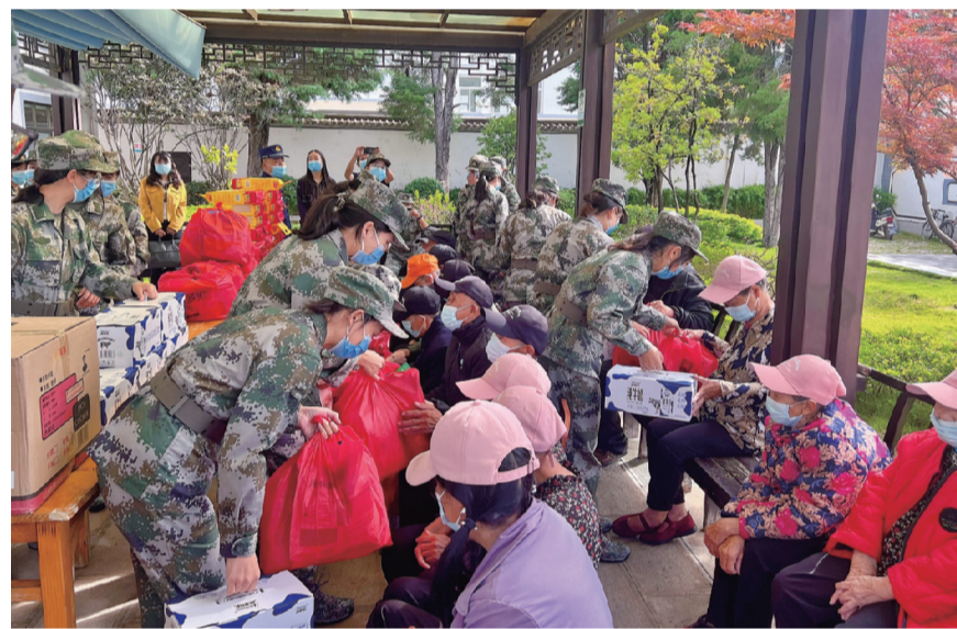
9月27日,巍山县第七届青年干部培训班学员到南诏镇敬老院开展敬老孝老活动。

此次竞赛为大理市快递行业从业人员搭建了切磋技艺、交流经验、展示技能的平台,激励了快递员爱岗敬业精神和创新发展热情,有助于推动快递行业安全、健康、科学、协调发展。