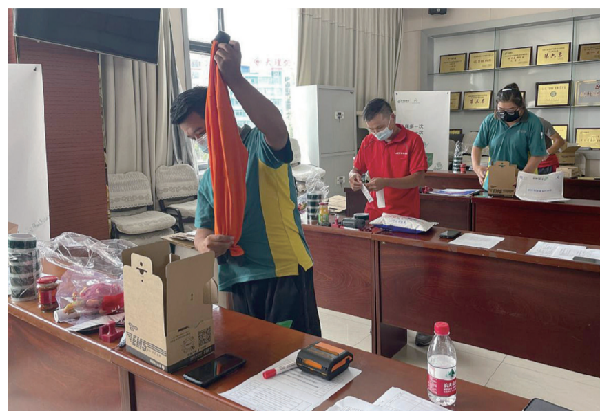
快递员们开展技能实操比拼。(摄于9月23日)

本报讯(通讯员 周芬文/图)近日,大理市举办第十五届职工技术技能大赛邮政系统快递员业务技能竞赛,92名快递员同台竞技。