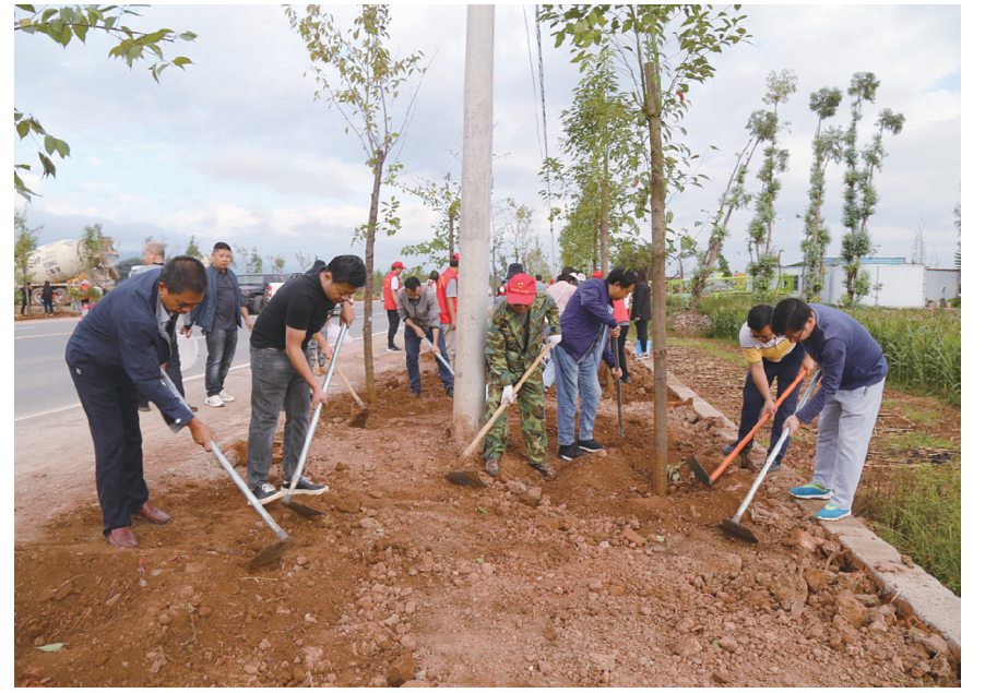
9月28日,弥渡县委组织全县干部职工开展义务植树活动。本次活动围绕果河公路开展,旨在对果河公路实施“四十里绿廊、十里一繁花”绿化行动,为建设名副其实的“小河淌水·幸福弥渡”添绿增彩。

性、现实紧迫性的领会把握,切实强化管党治党责任落实。要坚持问题导向,准确把握加强“一把手”和领导班子监督面临的严峻形势,采取有力措施,切实解决各项突出问题。要增强行动自觉,坚定不移推动全面从严治党向纵深发展。坚定对党忠诚的政治信仰,淬炼清正廉洁的政治品格,保持永不褪色的政治本色,涵养风清气正的政治生态,锻造过硬的政治队伍,护航弥渡高质量发展。要履行政治责任,不断加强全县各级各部门“一把手”和领导班子的监督,压紧压实主体责任,带头履行第一责任,认真落实“一岗双责”,充分发挥监督