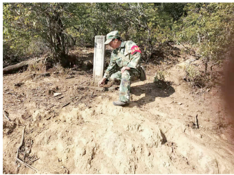
漾濞县苍山管护员在巡山护林，并清除保护界桩等管护设施周边的落叶。(摄于2021年12月29日)

推动平等融合，残疾人权益保障更加全面。认真做好残疾人信访接待和调处工作，共受理残疾人来访61件，发放信访解困经费5.01万元，持证残疾人自然变动情况在办证系统中适时更新，全面完成5587名持证残疾人基本状况调查工作。