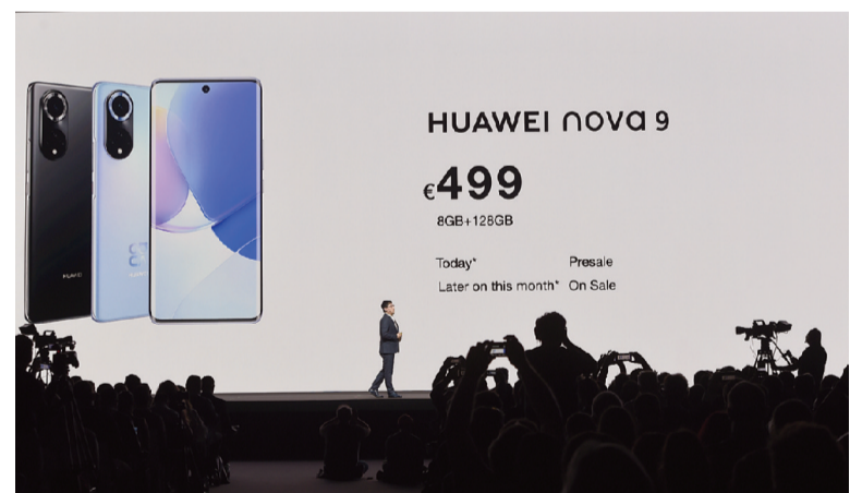
10月21日，华为新品发布会在奥地利维也纳举行。发布会上，华为向海外发布 nova9 手机并首次向全球发布新款 FreeBuds Lipstick 耳机和 GT3 智能手表。