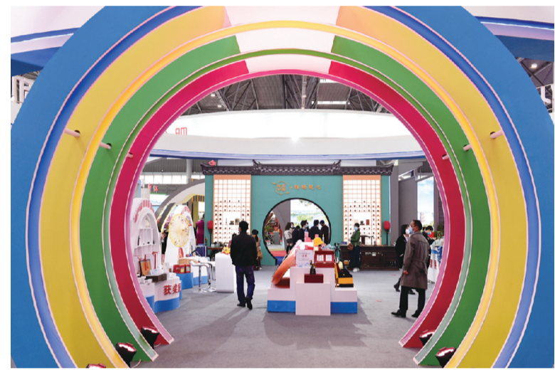
昨日，观众在第十五届合肥国际文化博览会上参观。10月22日，第十五届合肥国际文化博览会在安徽合肥滨湖国际会展中心开幕。