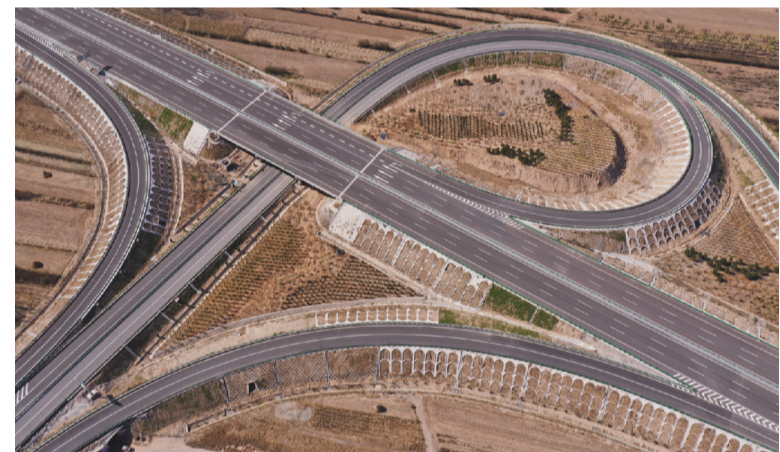
这是10月22日拍摄的河北迁曹高速公路京哈高速至雷庄互通段(无人机照片)。当日，河北迁曹(迁安—曹妃甸)高速公路京哈高速至雷庄互通段建成通车。