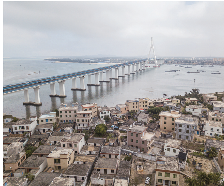
2月6日拍摄的海南海文大桥和海口北港岛一角(无人机照片)。海南海文大桥北港岛互通工程于2月4日建成通车。

费零售总额两年平均增长3.2%；全国固定资产投资两年平均增速为1.7%。 刘爱华分析，扣除基数影响，主要指标增势平稳，宏观指标处于合理区间。