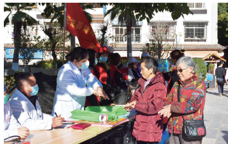
12月4日，云龙县卫健局在县城腾龙广场组织开展“七步洗手法”宣传和义诊活动。

截至11月30日，宾川县在“净餐馆”行动中，累计出动执法人员2060人次，执法车辆500余车次，指导餐饮服务单位开展“净餐馆”行动2436户，发出整改意见381份，餐饮服务单位完成洗手设施建设1673户，设置餐厨垃圾收容器1000个，收集车辆3辆，收集餐厨垃圾800余吨，2436户餐饮服务单位全部实现“七个达标”。