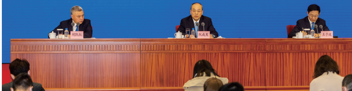
12月8日拍摄的云南脱贫攻坚情况新闻发布会现场。当日，国务院新闻办公室在云南省昆明市举行新闻发布会，介绍云南脱贫攻坚有关情况，并答记者问。

THE STATE COUNCIL INFORMATION OFFICE, P.R.C.