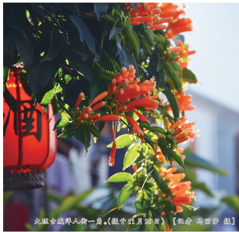
大理古城人群一角。(摄于11月29日)