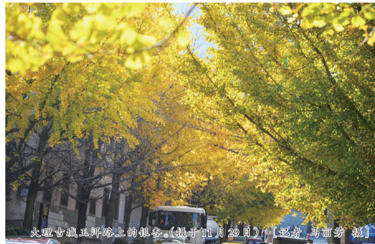
大理古城玉洱路上的银杏。(摄于11月29日)【记者 马丽芳 摄】