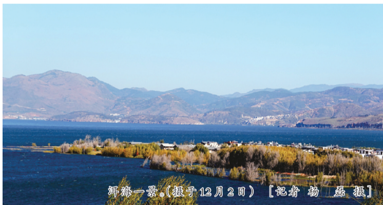
洱海一景。(摄于12月2日)