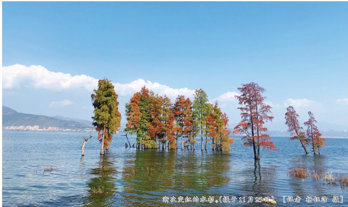
苍山变红的森林。(摄于11月25日)