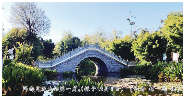
洱海月湿地公园一角。(摄于12月1日)