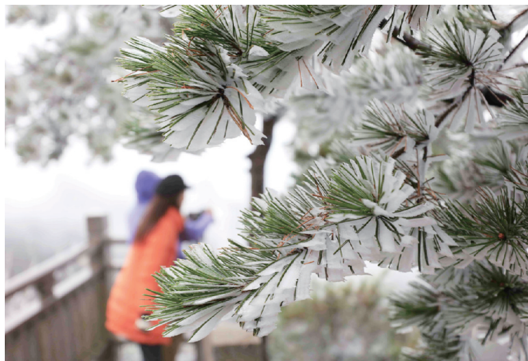
昨日,游人在张家界武陵源景区天子山欣赏雾凇景观。当日,受降雪降雾天气影响,湖南张家界武陵源景区天子山迎来入冬以来首次雾凇景观,吸引众多游客驻足欣赏。