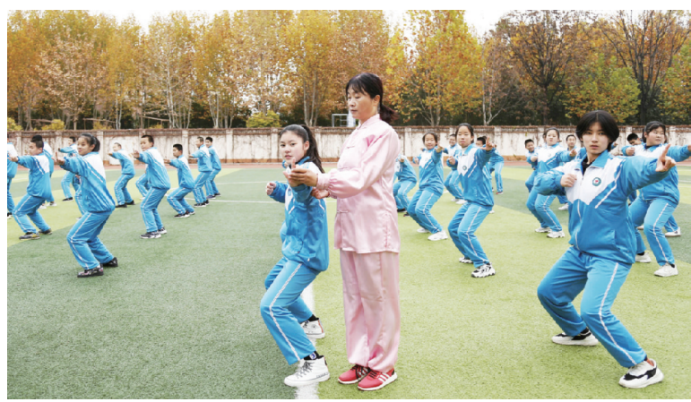
昨日,在邢台市第七中学,老师在指导学生练习八段锦。今年以来,河北省邢台市第七中学把八段锦引进校园,列入学校特色体育教育项目,让学生强身健体,缓解学业压力。