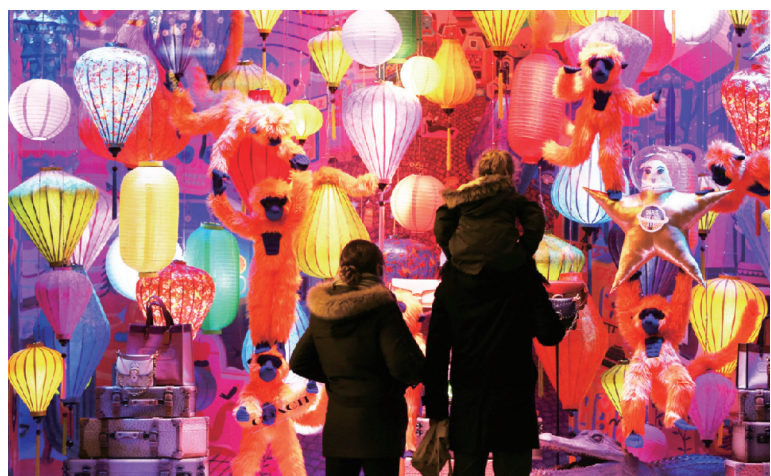
11月22日,人们在法国巴黎老佛爷百货商店的圣诞橱窗前驻足欣赏。受新冠肺炎疫情影响,法国目前仍处于全国“封城”阶段,商场尚未重新开门营业。然而,作为圣诞节“传统项目”的圣诞橱窗如约而至,为城市增添节日气息。