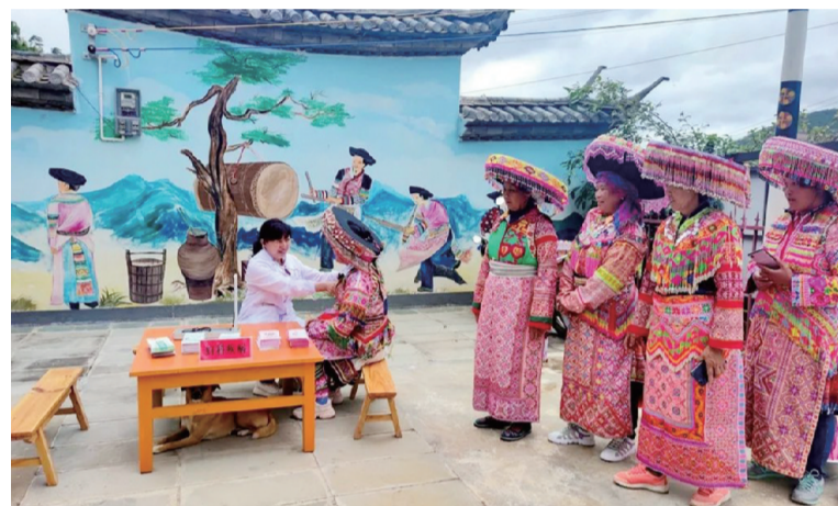
10月20日，南涧县妇幼保健计划生育服务中心健康服务医疗专家组，深入碧溪乡新虎村委会熊家苗族村，为18户群众开展健康服务义诊活动。当日，专家们为群众进行血压、血糖等健康检查，嘱咐群众注意老年病的早期预防，并送上健康生活服务礼包和宣传册页。

9时许从湾桥镇阳溪电站上山，顺着阳溪往东走。连日阴雨，让阳溪溪水暴涨，救援队员用钢绳牵引，穿过湍急的溪流，进入山林搜救。沿途地势险峻，他们多次拉着绳索经过断崖。14时左右，救援队员在海拔2800米左右的山坡上找到了4名被困人员，并安全营救下山。