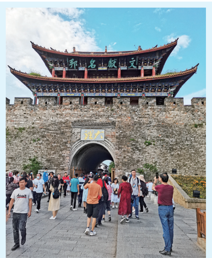
金秋时节,前来大理古城游览的游客络绎不绝。(摄于9月18日)

今年以来,我州以“解放思想再讨论、敢想敢干再出发”活动为抓手,进一步提升旅游品位、丰富旅游内涵,深化文化与旅游融合发展,推动文化旅游产业向差异化、品牌化、高端化、规模化发展。1至8月,全州共接待海内外旅游者2255.96万人次,实现旅游收入400.48亿元。