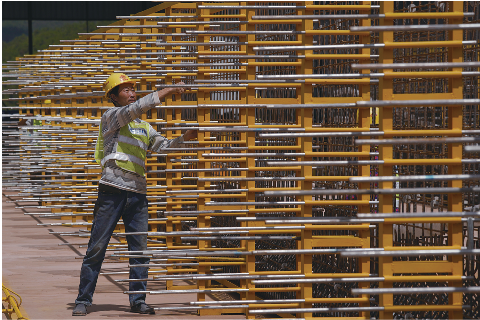
8月5日,工人利用定位管检查捆扎好的T梁钢筋骨架间距是否符合技术标准。所有施工环节都按照标准化和“高起点、高要求、高质量、重环保”的要求严格执行。

8月5日,中国铁建昆仑投资集团云南投资有限公司云南楚大高速公路扩容工程第六总承包部土建3标1#梁场,工人和技术人员正在捆扎、检查已成型的第二片预制T梁钢筋骨架、吊装模板,梁场两侧沿线也正在进行路基或桥墩施工,各项工程正在有条不紊地施工中。