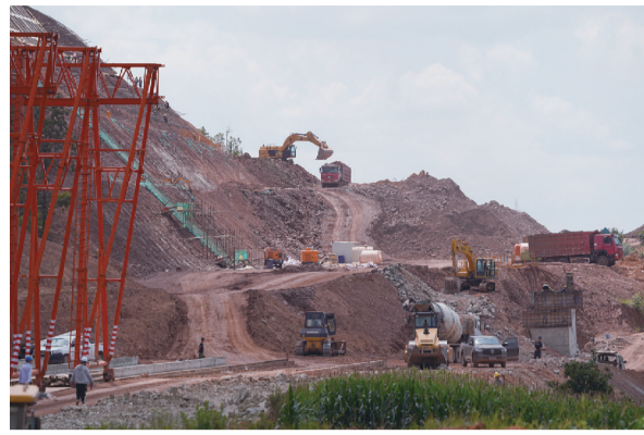
8月5日,梁厂西边至大理方向正在进行路基工程施工。