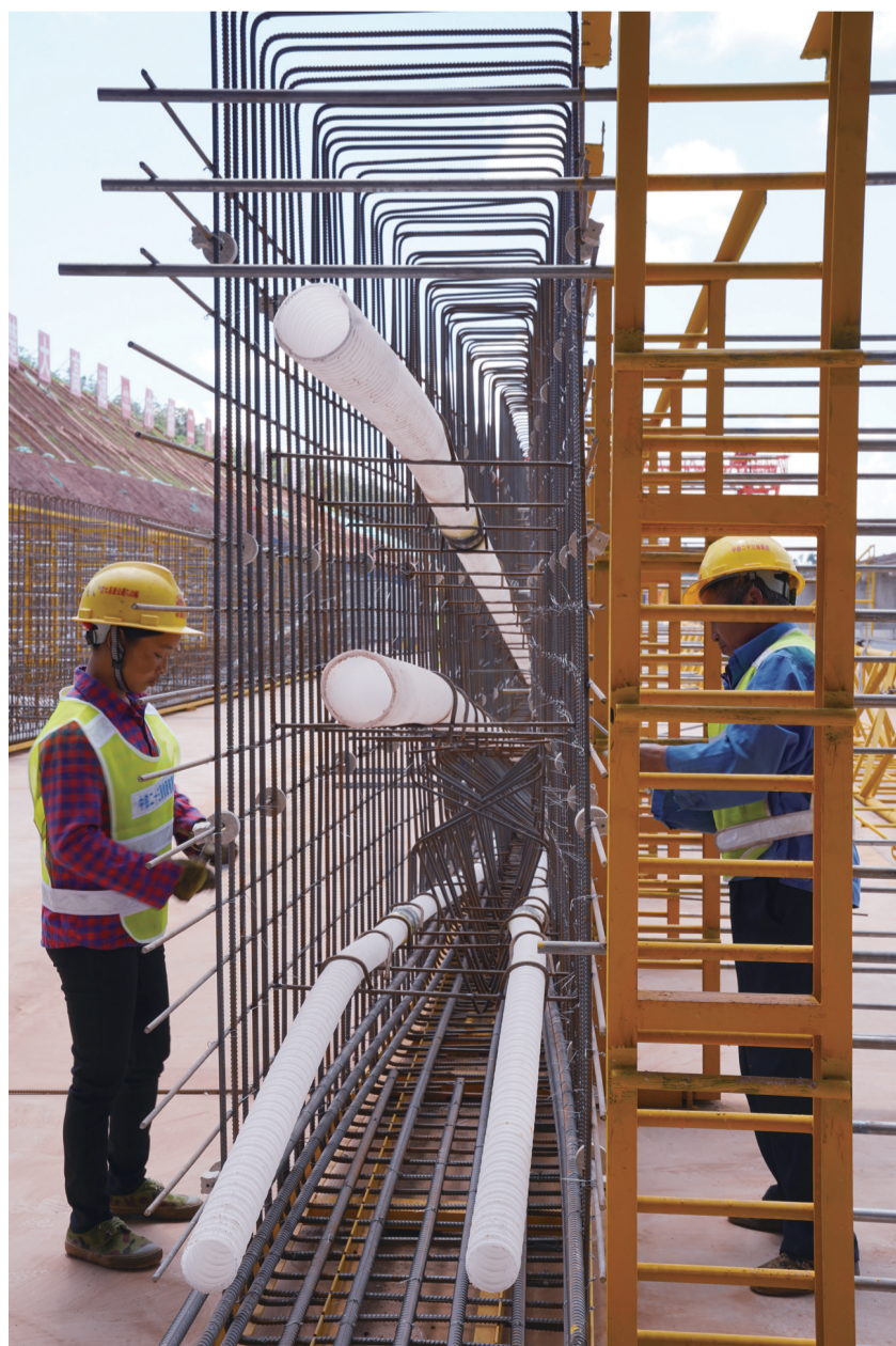
8月5日,捆扎成型的T梁钢筋骨架,四根白色波纹管将在T梁保养后穿入预应力钢绞线,是高架桥承重的主要构件之一。