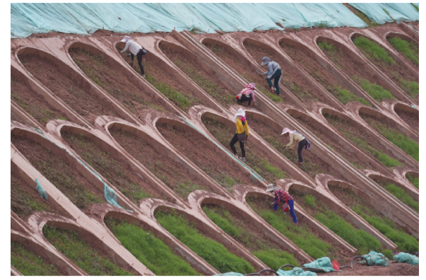
8月5日,梁厂南侧的拱形边坡正在进行喷播植草。