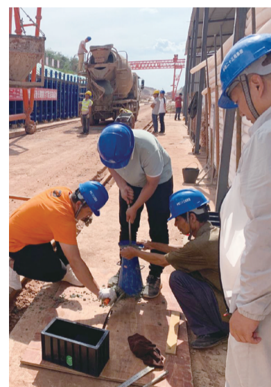
7月28日,首片T梁浇筑前,技术人员对混凝土进行强度检测试验。