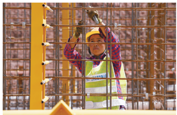
8月5日,认真工作的女工人。认真、负责在每一个施工环节中都十分重要,更是施工质量的保证。