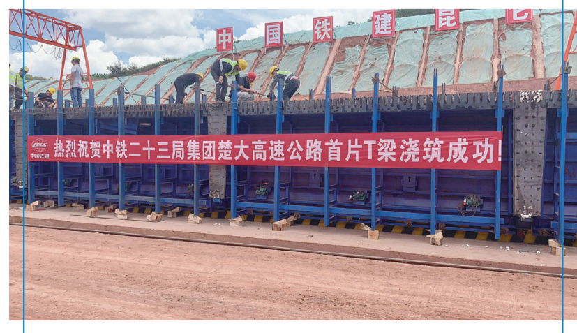
7月28日,首片T梁浇筑中。