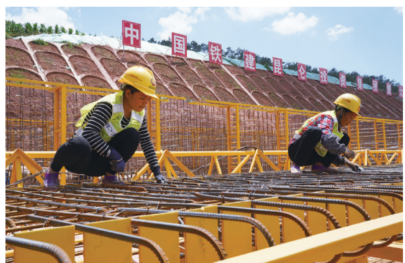
8月5日,正在捆扎T梁钢筋骨架的工人。