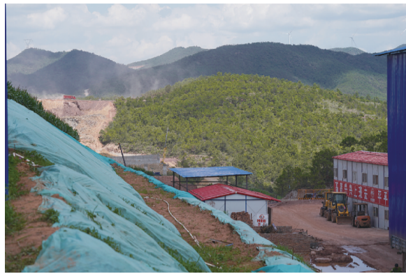
8月5日,梁厂东侧至昆明方向,远方正在进行路基工程施工,这里,将依次修建松弛地大桥、贝金乍大桥、罗子菁大桥和鹦哥么大桥。