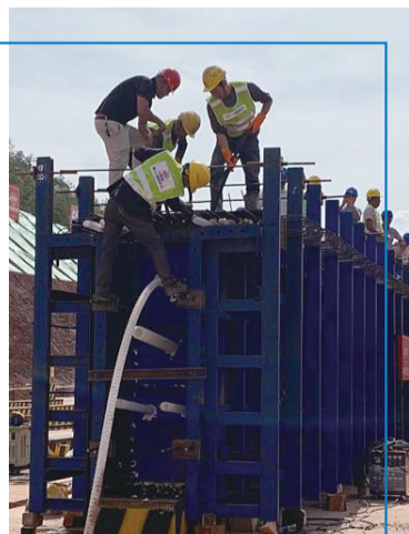
7月28日,首片T梁浇筑中。