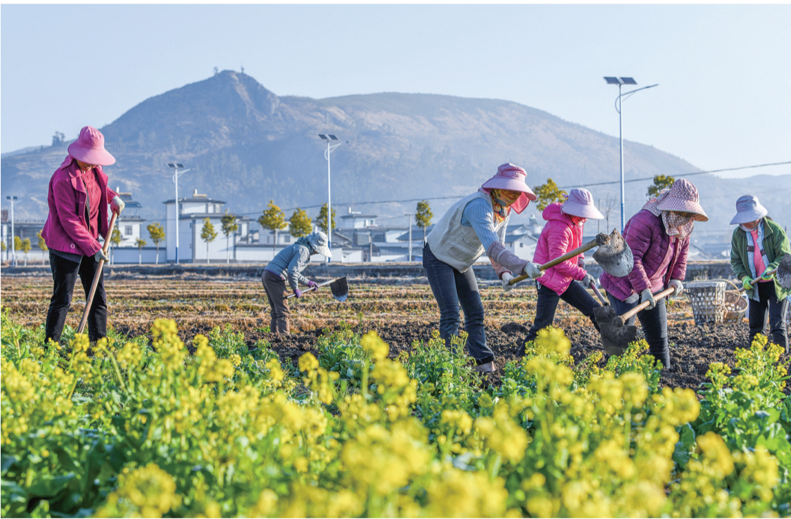
2月21日,剑川县金华镇龙凤村,当地群众在平整田垄,准备进行反季无公害蔬菜种植。