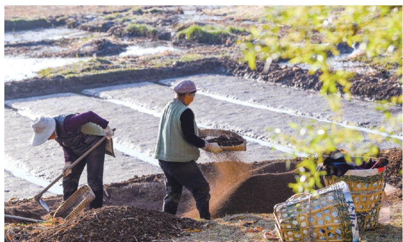
3月14日,剑川县金华镇西中村,群众正在用筛子准备肥土。