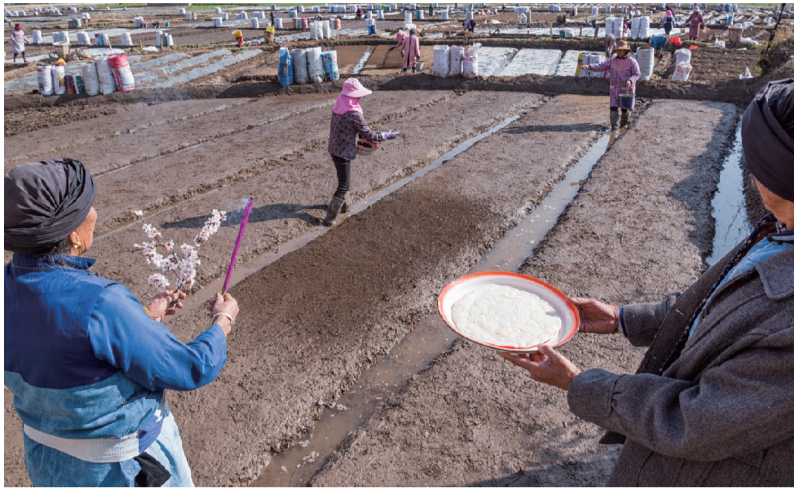
3月12日,剑川县甸南镇兴木村,白族群众进行祭祀仪式开始今年的播种。

一年之计在于春,只有春天的辛勤耕种,才会有秋天的丰收景象。当前,剑川抢抓节令,积极开展春耕备耕工作,田间地头到处都忙碌着白乡群众勤劳的身影。