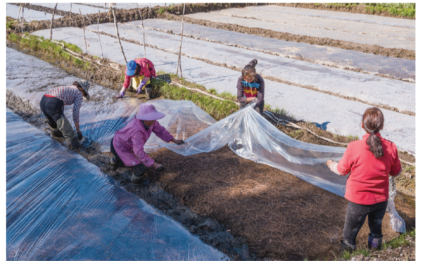
3月14日,剑川县甸南镇西中村,群众相互帮助进行薄膜覆盖地膜。