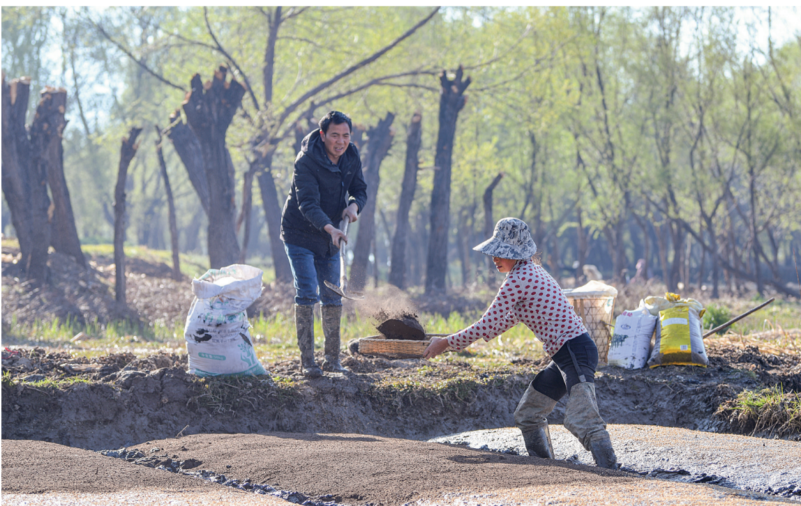
3月14日,剑川县甸南镇西中村,两个人配合进行水稻种子盖土工作。