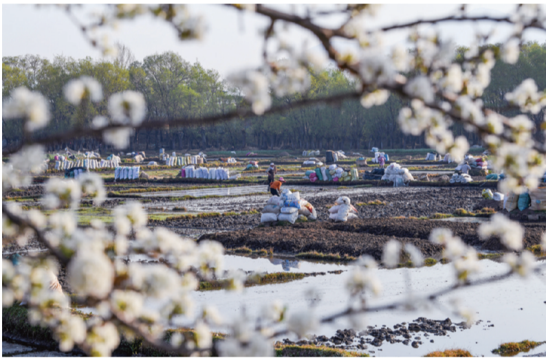
3月13日,剑川县金华镇柳营村,群众开始进行水稻育苗前的田垄整理工作。

当前,剑川各地正在积极开展水稻育苗工作,整个育苗工序很多,也充满着仪式感。春节一过群众就要开始进行蓄肥土,肥土主要是就地取材,通过对田里的土进行闷烧,然后用农具把烧过的肥土敲碎,再用筛子筛出细粉装在口袋里整齐地堆放在田边,用来撒盖在水稻种子上,用肥土做成的肥料天然、生态;第二步就是秧田的平整,根据田块大小形状垒成宽度大致统一的田垄,待春耕放水之后又用泥铲把田垄表面抹平;第三步就是在光滑平整的田垄表面撒上水稻种子,再用事前准备好的肥土用筛子均匀地撒在水稻种子上盖好,最后用塑料薄膜覆盖,两个星期之后就可以把塑料薄膜拆掉,秧苗养到五月初就可以拔出来进行插秧了。