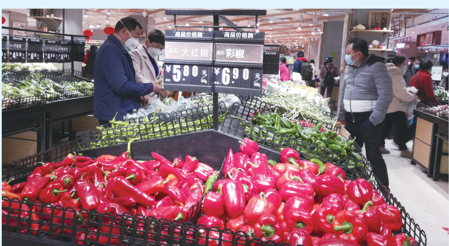
2月2日,市民在大理市大興量贩超市选购新鲜蔬菜。近期,全州各级农业农村部门联合市场监管、商务等相关部门,全力以赴抓好疫情防控期间鲜活农产品稳产保供工作,以满足群众生活所需。