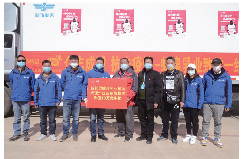
昨日上午,云南新希望邓川蝶泉乳业有限公司向大理州疫情防控指挥部捐赠3.84万盒、总价值10.8万元的牛奶,用实际行动支援我州新型冠状病毒感染肺炎疫情防控工作。

“疫情就是命令,防控就是责任。”该公司一位负责人表示,全力以赴参与疫情防控是企业义不容辞的责任,相信在各级党委、政府的坚强领导下,一定能打赢这场疫情防控阻击战。