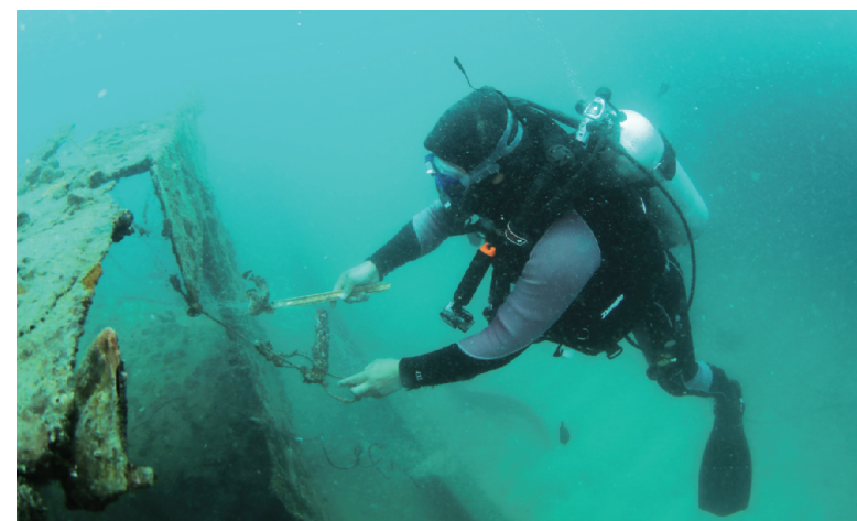
昨日，三亚蜈支洲岛旅游区工作人员在海洋牧场把被渔网缠住的鱼救出来。当日，海南三亚蜈支洲岛旅游区工作人员在海洋牧场进行日常巡护，维护水下设备，进行环境清洁等工作。蜈支洲岛海域海洋牧场人工鱼礁表面附着珊瑚、贝类、藻类等生物种类达120余种，鱼礁区比非鱼礁区鱼类种类数量提高5至10倍。