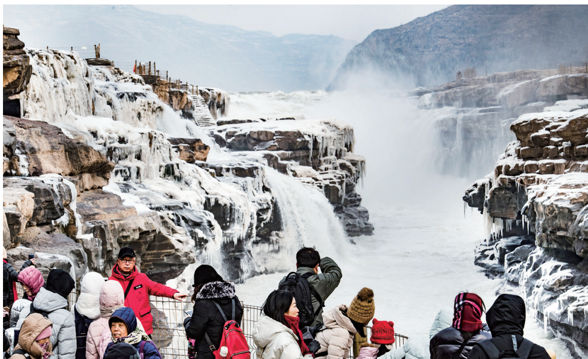
昨日，游人在陕西黄河壶口瀑布景区内游览。

隆冬时节，位于晋陕交界的黄河壶口瀑布飞溅的浪花在瀑布两岸岩石上凝结形成冰瀑冰雕，成为冬季壶口瀑布景区一道奇特的景观，吸引游人前往观赏。