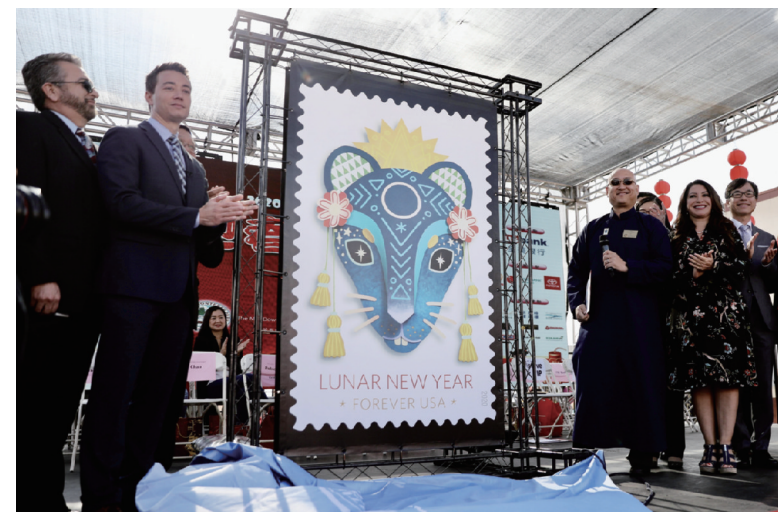
1月11日，在美国洛杉矶破晓特别公园中，嘉奖参加鼠年春节联欢晚会。英国邮政局当日发行了农历鼠年生肖邮票和首日封。

澳大利亚多地发生的严重林火灾害已持续数月。澳官方宣布，自2019年7月澳进入林火季以来，高温天气和干旱是林火肆虐的主要原因。从经济最发达、人口最稠密、新州和维州所在的东南部沿海地区，到塔斯马尼亚、西澳州和北领地，几乎每个州都有林火在燃烧。