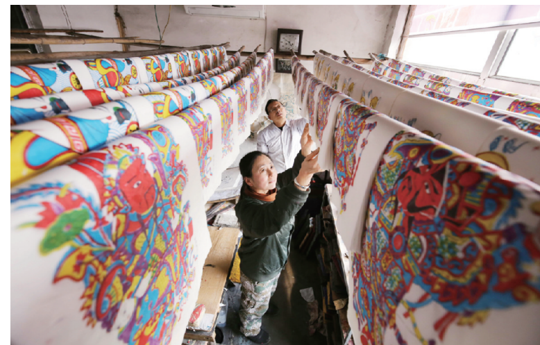
1月11日，山东省潍坊市寒亭区杨家埠村年画艺人在晾晒刚刚印制好的木版年画。春节临近，在素有“年画之乡”美誉的山东省潍坊市寒亭区杨家埠村，年画艺人们忙着印制木版年画，以供应节日市场。