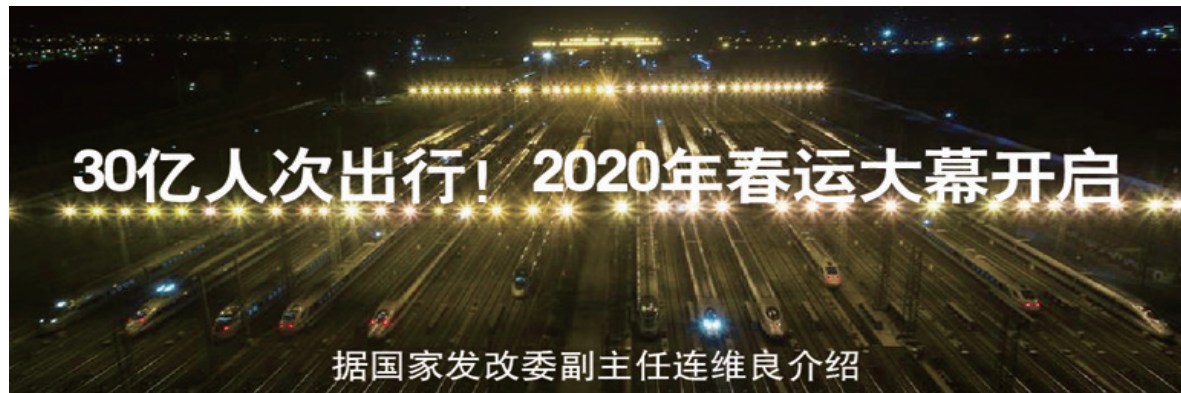
据国家发改委副主任连维良介绍

无论山多高、水多长、路多远，普天同庆的春节，中国人都要努力回到家乡。乡村是我们的家，城市也是我们的家，娘家婆家都是家。城与乡要融合，国与家是一体，在祖国就不会有“异乡”。火车正进站，飞机已起飞，春节来了，春天近了，我们期待“欢乐春运”最终实现，那时绿皮车都要成为一种风景，春运将成为流动中国的温暖象征，一场从家到家的温馨旅程。